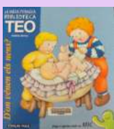
I 612.6 DEN

En Teo i els seus amics són a l'escola i s'assabenten que la Sra, la seva mestra, espera un bebè. Aquest fet motiva les preguntes dels nens al voltant dels temes relacionats amb el naixement. Aquest és el tema que planteja el llibre per tal que nens i adults puguin fer plegats la descoberta d'aquest meravellós misteri de la vida.